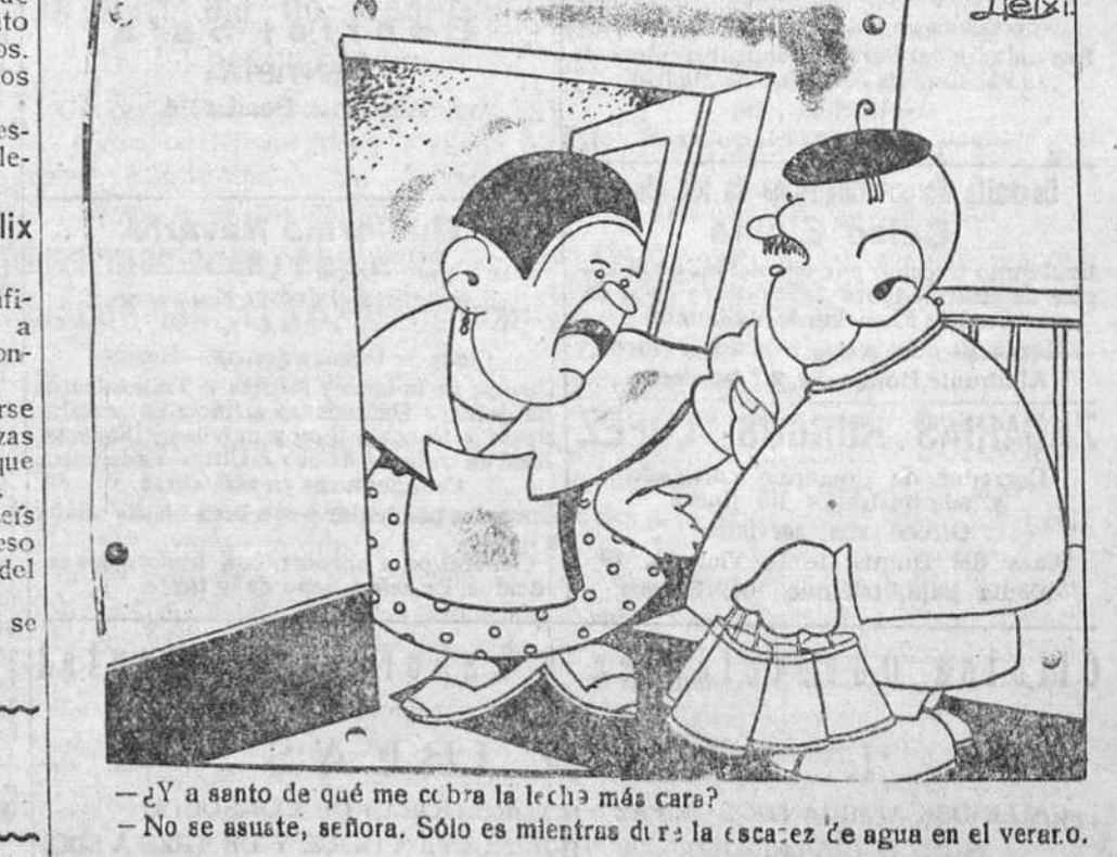
—¿Y a santo de qué me cobra la leche más cara? —No se asuste, señora. Sólo es mientras dura la escasez de agua en el verano.

Los exámenes darán principio el 1 de Julio y están convocados 16 cada día.