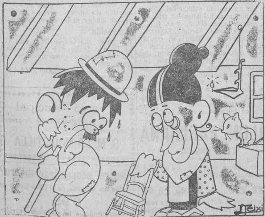
—¿Sabes lo que me ha recetado el médico? —¡Qué sé yo! —Que no trabaje, que coma mucho, que me distraiga y que viaje.

CONSULTORIO DEL DR. SALAS Alcalá, 76.—Madrid.