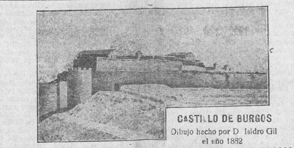
CASTILLO DE BURGOS Dibujo hecho por D. Isidro Gil el año 1892