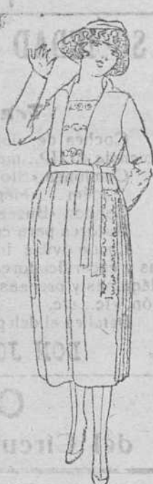
Vestidos sarga de algodón negroycolores, de 25 á 50 ptas.