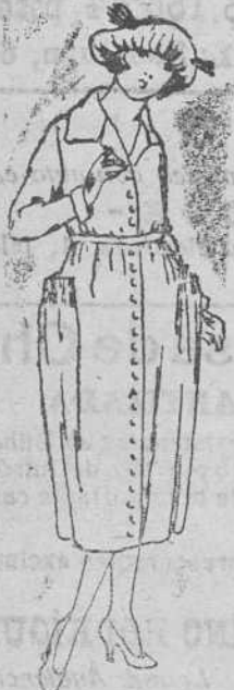
Vestido sarga inglesa estambre, etc., en azul y color, de 40 á 90 pesetas.