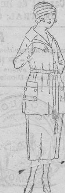
Treje levita en lana y algodón, negro y colores, de 50 á 150 ptas.