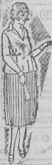
Faldas plisadas, de lana, á 25, 30 y 35 pesetas una.

Primera casa en confeccionar de caballero, señora, niños y niñas