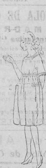
Vestidos niñas, edad 10 á 15 años, de 18 á 30 ptas.