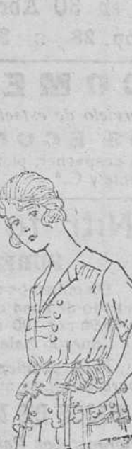
Buzos de punto doble á 20, 35, 40 y 50 pesetas.