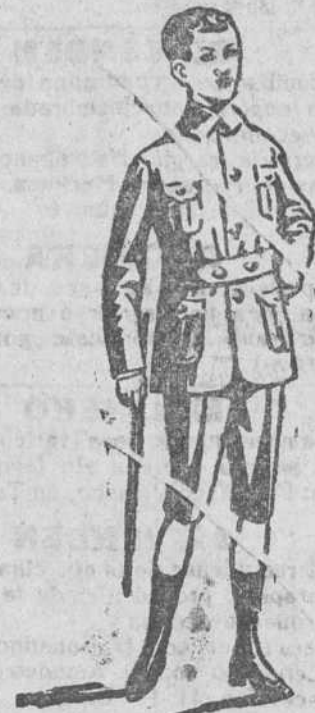
Traje de paño, forma sport, á 20, 25 y 30 pesetas.