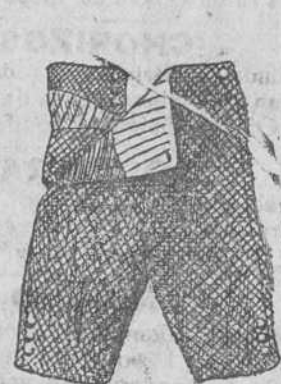
Pantaloncitos de paño y pana, á 4, 4, 50, 5, 6 y 7 ps.