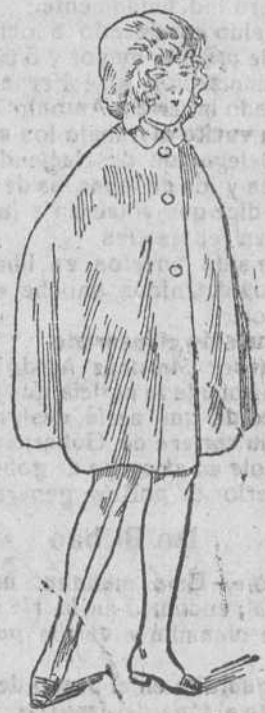
Capitas impermeables, á 15, 18, 20, 25 y 30 pts.