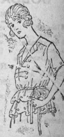
Jerseys lana, en colores novedad, á 15, 18, 20 y 25 pts.