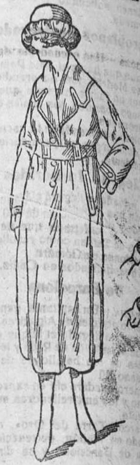
Gabardinas señora, desde 110 á 140 pts.