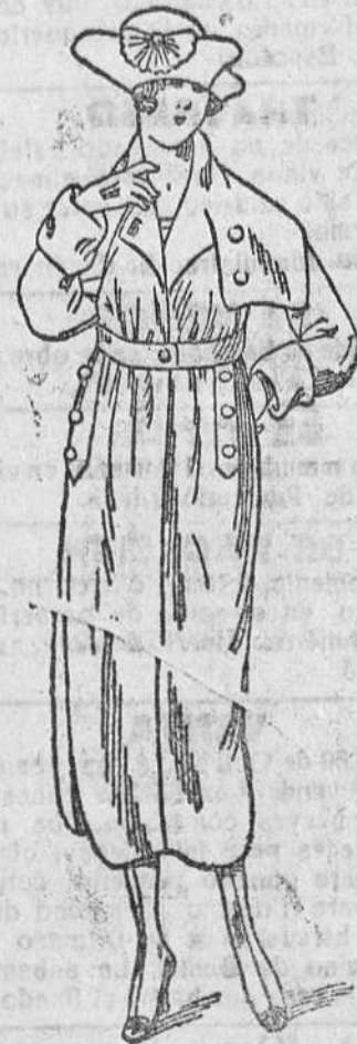
Abrigos novedad, en gamuzas, desde 55 á 150 pts.

Primera casa en confecciones de caballero, señora, niños y niñas