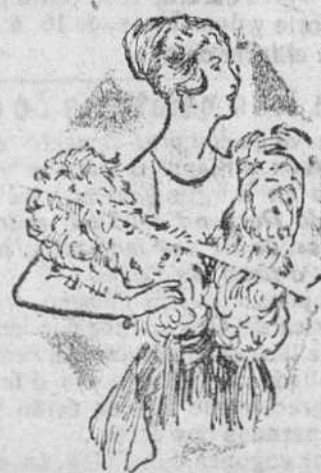
Cuellos de pluma «Saldo» desde 25 á 65 pts.