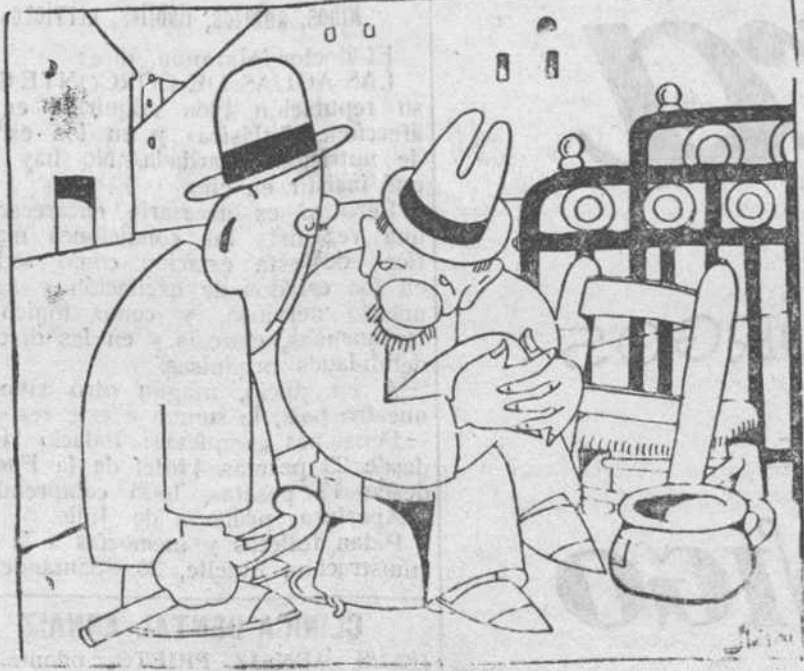
—¿Cómo ha sido eso? —Pues nada, El casero que se ha empeñado en votarme y me ha botado.

DENTISTA Sucesor del doctor Mardones RAYOS X Plaza de Prim, núm. 23, Burgos Cirugía de la boca y dientes :: Tratamientos sin dolor :: Dentaduras artificiales de todas clases :: Puentes fijos y móviles :: Especialidad en trabajos de oro :: Últimos adelantos :: Composiciones en seis horas Consulta particular y con hora fija: de nueve a doce Reducidos de seis a ocho de la tarde General para obreros con honorarios módicos. Duque de la Victoria, 19, principal, Izquierda.