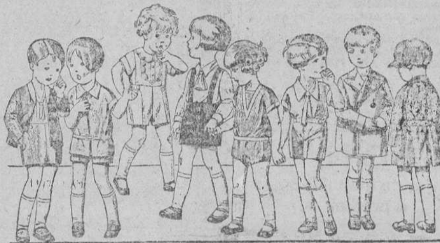
20 diferentes modelos de peleles y trajecitos para niños de 2 a 5 años, en terciopelo, dril, lana y otomán, a 3'50, 4, 5, 6, 8 y 10 pesetas.

PARA CABALLERO, SEÑORA, JOVENES Y NIÑOS SASTRERIA Y PANERIA TELÉFONO 603 R Establecimiento Oficial del Turing Club Español