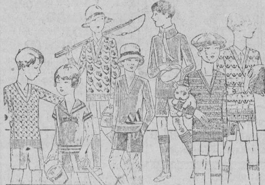
Jerseys y pullover novedad, en lana y algodón, de 4 a 10 pesetas. Modelos y colores novedad. Pantaloncitos cortos de paño, pana, dril y terciopelo.