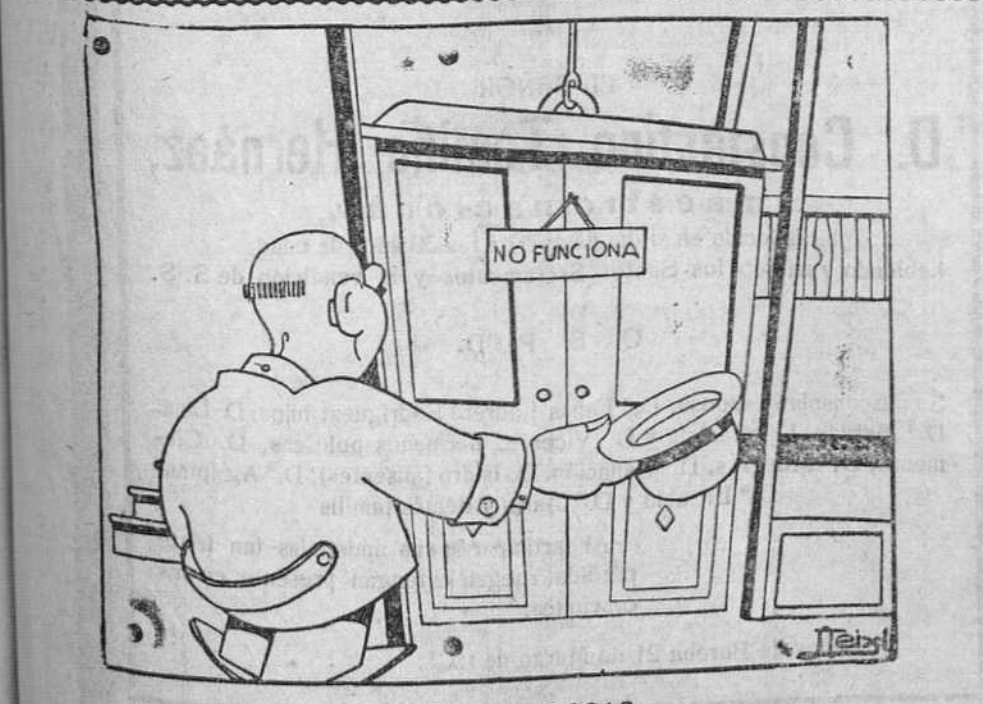
ASI SON LAS COSAS... Subió la carne, también el vino. ¡Ya todo está por las nubes! Sin embargo... ¡Oh, burgués peregrino! Tú, que debieras subir, no subes.

ESTE NUMERO HA SIDO VISADO POR LA CENSURA