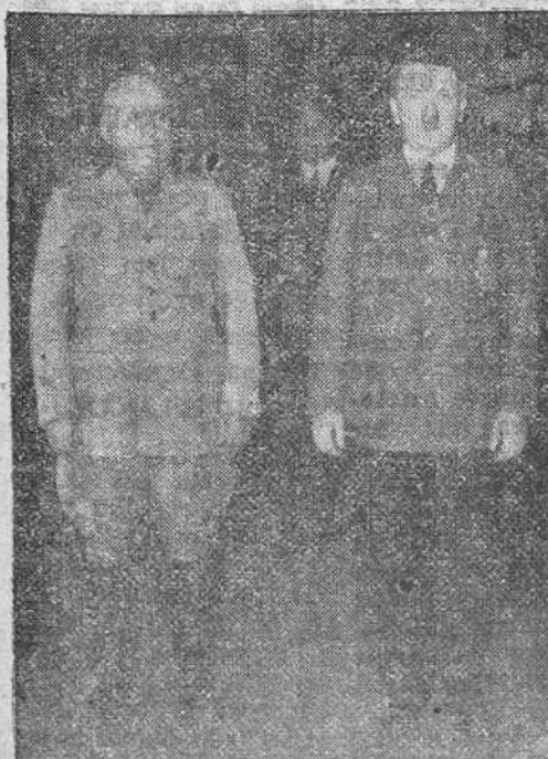
Los dos hombres de quienes depende el futuro destino del mundo