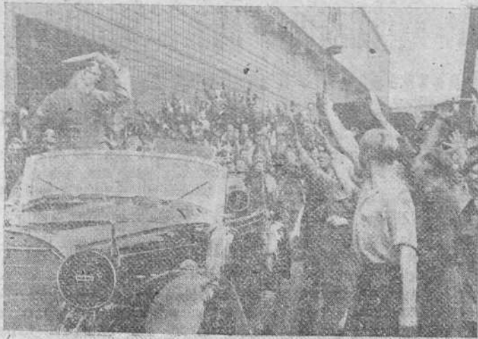
HITLER, EN LA GRAN FORJA DE ARMAS DEL REICH

Claro que para muchos de éstos es más cómodo que lo relacionado con los asuntos sociales se resuelva otro, mientras ellos se dedican a malgastar sus dotes de organizador en mentideros y corrillos, cuando si estuvieran sindicados además de obtener los beneficios anteriormente citados, podrían ayudar y laborar por el bien de todos sus compañeros de trabajo; así esperamos que antes del 1.º de Octubre no quede por registrar ningún empleado de comercio, ningún empleado de banca, ningún empleado de banca, ni que decir que cuanto más sindicatos tengamos más fuerza moral adquiriremos para lograr cuantas mejoras se soliciten por mediación de nuestro Sindicato.