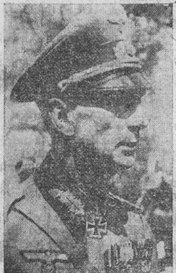
El general Dietl, heroico jefe de las operaciones en el sector de Narvik, condecorado por el Führer con la Gran Llave de la Cruz de Caballero

Fuerzas navales alemanas han hundido en aguas austríacas el vapor mercante armado británico «Turakna», de 8.706 toneladas. Nuestros submarinos han hundido en los ocho últimos días más de cien mil toneladas de barcos enemigos. Un submarino ha hundido más de ocho mil y otro a los mercantes británicos armados «Severn Leygh» de 5.242 toneladas y el «Brockwood» de 5.010 y un tercer barco mercante de 4.000. Otro de