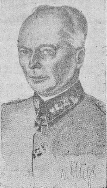
KLUGE General ascendido a Mariscal de Campo