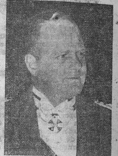
MILCH General ascendido a Mariscal de Campo Inspector general de Aviación

LONDRES.— Comunicado del Ministerio del Aire y Ministerio de Seguridad: «Esta mañana fué atacado Douvres, por fuego de cañón, desde la costa francesa, resultando ligeros daños en edificios y algunas víctimas. Más tarde, el enemigo dirigió