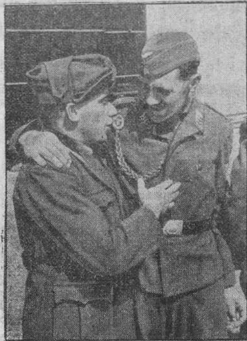
DOS HERMANOS DE ARMAS. Un soldado alemán y un italiano. Luchan por el mismo ideal de una justicia basada en la Paz por el Pan, el Trabajo y la comprensión entre los pueblos tradicionales de su Historia.