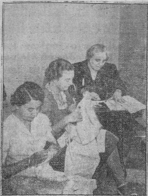
EL TRABAJO DE LA MUJER PARA LA GUERRA Mujeres de la Colonia Alemana, de Roma, trabajando al Servicio de la Cruz Roja Italiana. Este trabajo es voluntario y gratuito en absoluto.