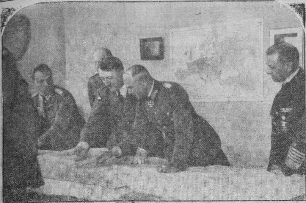
HITLER ESTUDIA PLANES DE GUERRA CON SU ESTADO MAYOR

¿Es la invasión de Inglaterra? ¿Son nuevos ataques aéreos a las islas? El tiempo desvelará la incógnita, pero mientras, los planes de guerra alemanes siguen su línea invariable, encaminada a aniquilar el poder del enemigo