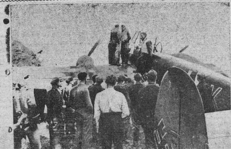
Una escuadrilla de destructores alemanes perdió un aparato en uno de los grandes bombardeos sobre Inglaterra. Ya se le había incluído entre las bajas, cuando se presentó en su base, entre el júbilo de los compañeros. He aquí la tripulación contando las palpasias del vuelo.

Terminó su discurso diciendo que, después de la victoria, Gran Bretaña construirá un Mundo nuevo sobre bases más justas que el Mundo antiguo.—Efe.