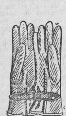
Guantes piel, a 7 8 y 10 pesetas.