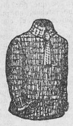
Jersey lana, a 8, 10 y 12 pesetas. Idem algodón, a 3-50, 4 y 5.