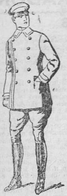
Traje para chauffeur de pelo melton, a 85, 90 y 100 pesetas

Gran casa de tejidos, pañería y confecciones de caballero, señora y niños