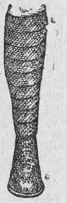
Bandas alpinas a 5 6 y 7 pesetas. Militar, a 7-50.