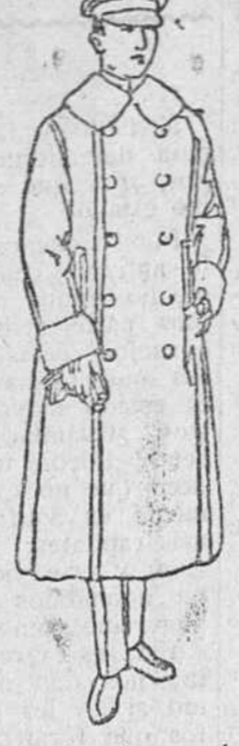
Abrigo chaffeur azul verde negro, botones dorados, a 110 y 120