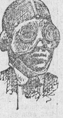
Pasamonianas punto a lana a 3 4 y 5 pts Gafas a 3, 4 y 5 pts

Precio fijo verdad. Todos los artículos marcados.