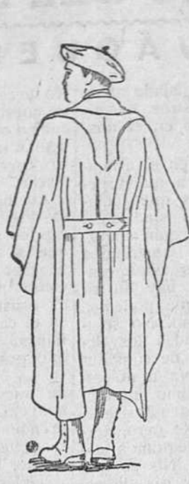
Capote paño primera a 72 Traje drill a 36 pesetas Idem paño, a 60