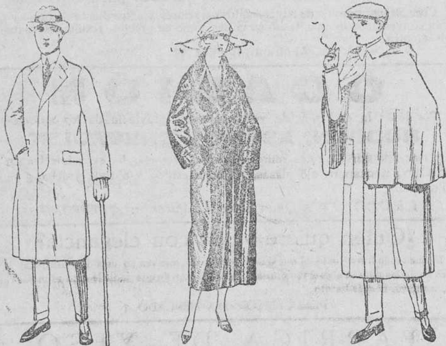
Gabardinas de lana, desde 90 á 160 pesetas. Gabardinas novedad, á 90, 100, 115, 125 pts. Impermeables seda de 100 á 160 pts. Impermeables á 110, 115 y 125 pesetas.

Precio fijo verdad. Todos los artículos marcados.