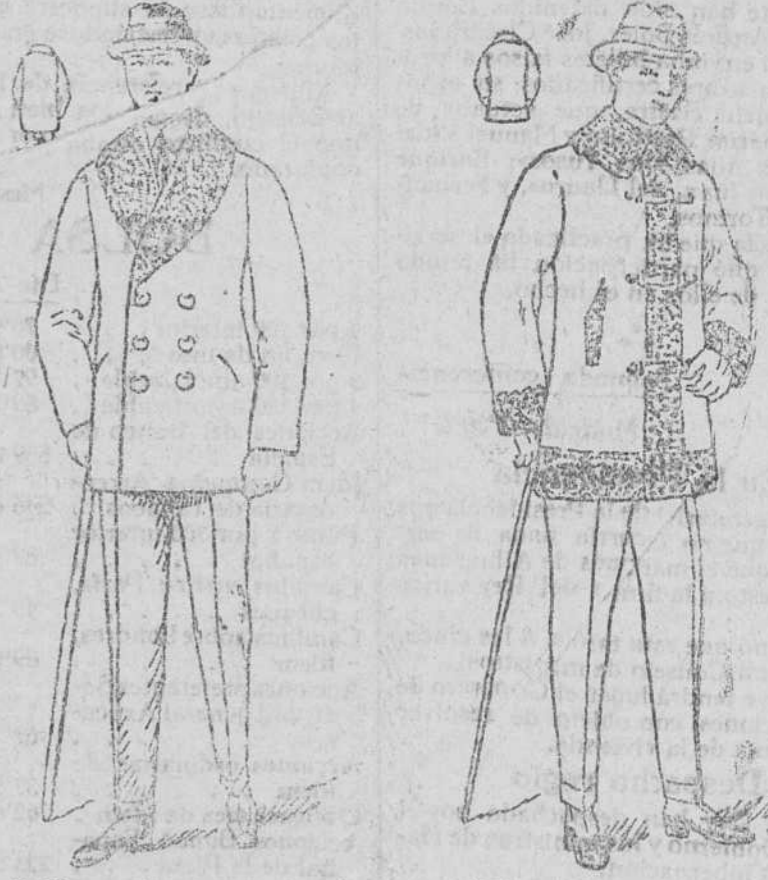
Pellicas paño pluma, rizo al cuello, de 25 á 100 pesetas Pellicas de paño arrasado, cuello y mangas de rizo, desde 30 á 75 pesetas

Gran casa de tejidos, pañería y confecciones de caballero, señora y niños