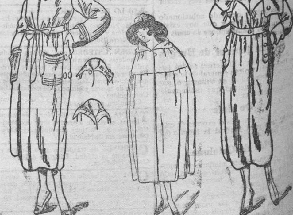
Grandes novedades en abrigos de paño, desde 30 á 175 pesetas Capas novedades, desde 60 á 150 pesetas