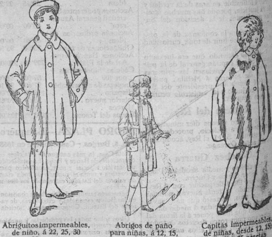
Abriguitos impermeables, de niño, á 22, 25, 30 y 35 pesetas

Plaza Mayor, 42, y Lain-Calvo, 9. Teléfono número 88. Burgos Gran bazar de ropas confeccionadas de caballero, señora y niños