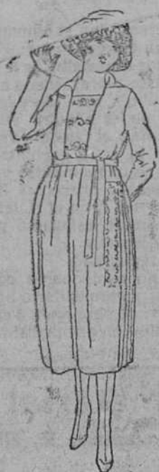
Vestidos enteros, en lana y color, á 35, 40, 45, 50 y 55 pts.