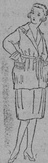
Trajecitos para jóvenes, en algodón, á 30 y 35 pts.