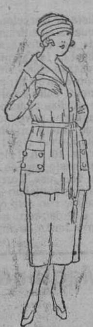
Vestidos de levita y faldas, en lana, á 45, 50, 60, 70 y 80 pts.