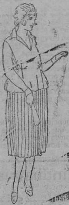
Blinca punto seda á 35, 40 y 50 pts. Faldas plisadas á 30, 35 y 40 pts.

En esta sección de señoras y niñas, encontrarán siempre los últimos modelos en vestidos enteros y de levita, en todos los colores, creas y estilos.