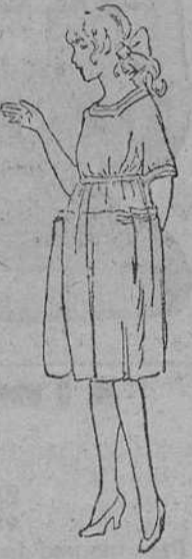
Vestidos para niñas en lana á 14, 16, 18, 20, 25 pts. Modelos novedad