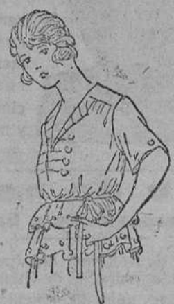
Blinca de punto, en diversidad de colores, 14, 15, 16, 20 y 25 pts