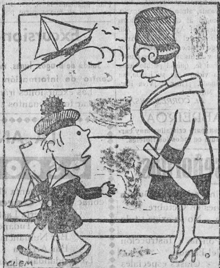
—Mamá, no dejes de llevar unos caramelos por si lloro en el paseo.

Se nombra a don Daniel Benito Carraz, encargado de la estación telegráfica universal de Lerma, con carácter interino y la gratificación anual de 2.000 pesetas.