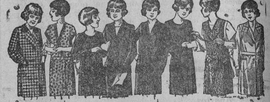
Vestidos para niñas de 8 a 14 años, en crepón, seda o lana, de 12, 15, 18, 20 y 25 pesetas.

La Casa que más surtido presenta y más barato vende