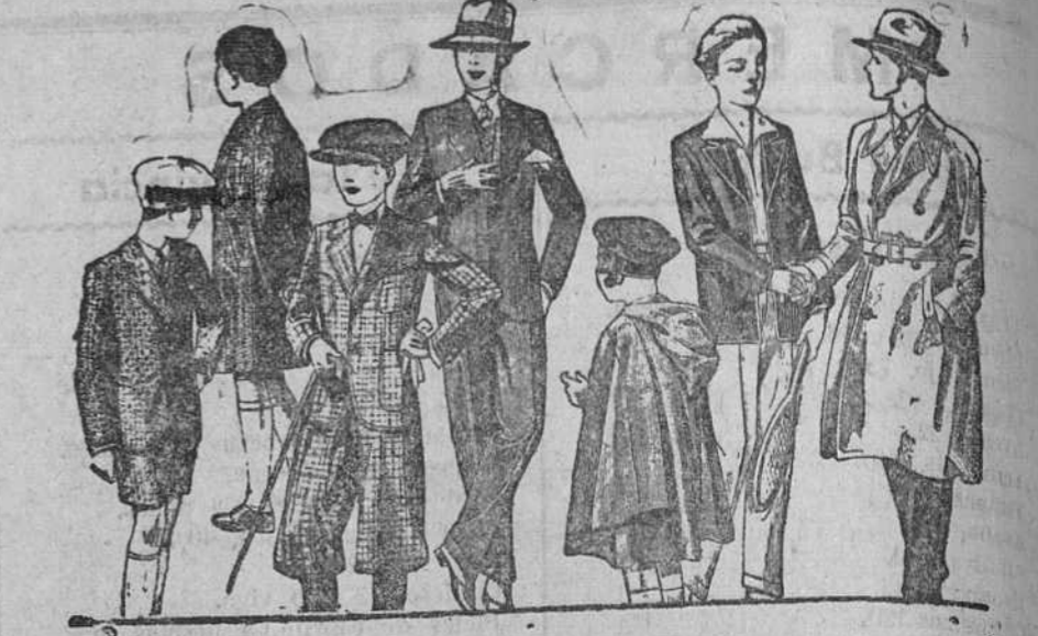
Abrigos y trajes de paño, modelos nuevos de 20, 25, 30, 35, 40 y 50 pesetas

Primera casa en confecciones para caballero, señora y niños Plaza Mayor, 42, Lain-Calvo, 9 y 11.—Sucursal: Plaza Mayor, 8, Burgos