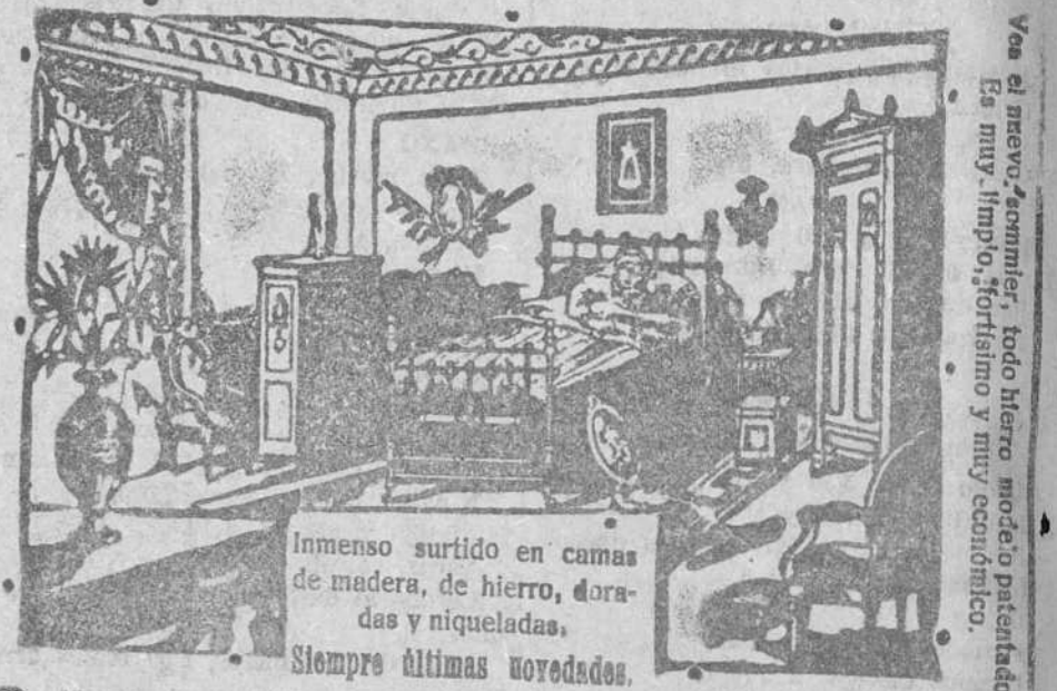
Inmenso surtido en camas de madera, de hierro, doradas y niqueladas. Siempre últimas novedades.

Calle de Vitoria, número 14.-BURGOS En esta Casa se vende el somier «Numancia»