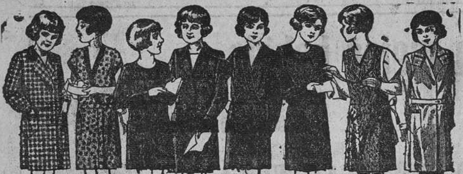
Vestiditos para niñas de 8 a 14 años, en crepón, seda o lana, de 12, 15, 18, 20 y 25 pesetas.