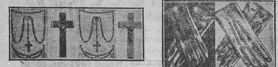
Rosarios, cruces y libros para Primera Comunión, a 2, 3, 4, 5, 6, y 8 pesetas. Guantes blancos para Primera Comunión, a 2, 2,50 y 3 pesetas.