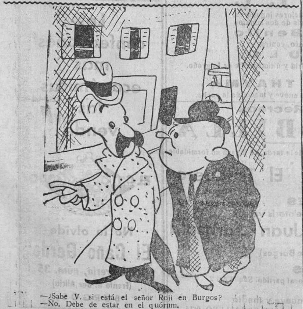
—Sabe V. si está el señor Roji en Burgos? —No. Debe de estar en el quórum.