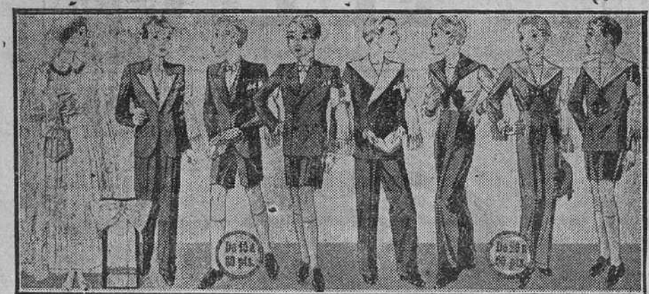
Diversidad de modelos de trajecitos para Primera Comunión, en lana blanca, lana gris y en azul, a 20, 25, 30, 40 y 50 pesetas.