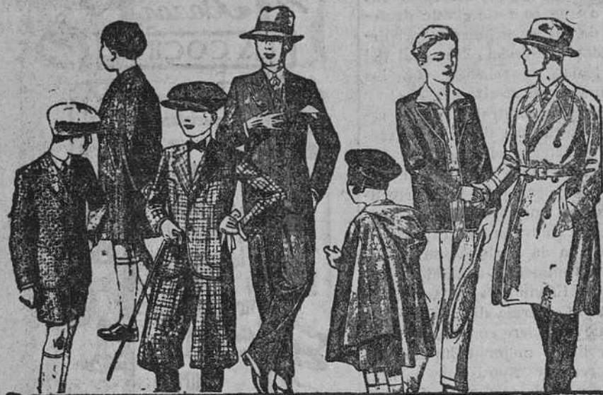
Abrigos y trajes de paño, modelos nuevos de 20, 25, 30, 35, 40 y 50 pesetas

Primera casa en confecciones para caballero, señora y niños Plaza Mayor, 47, Lain-Calvo, 9 y 11.