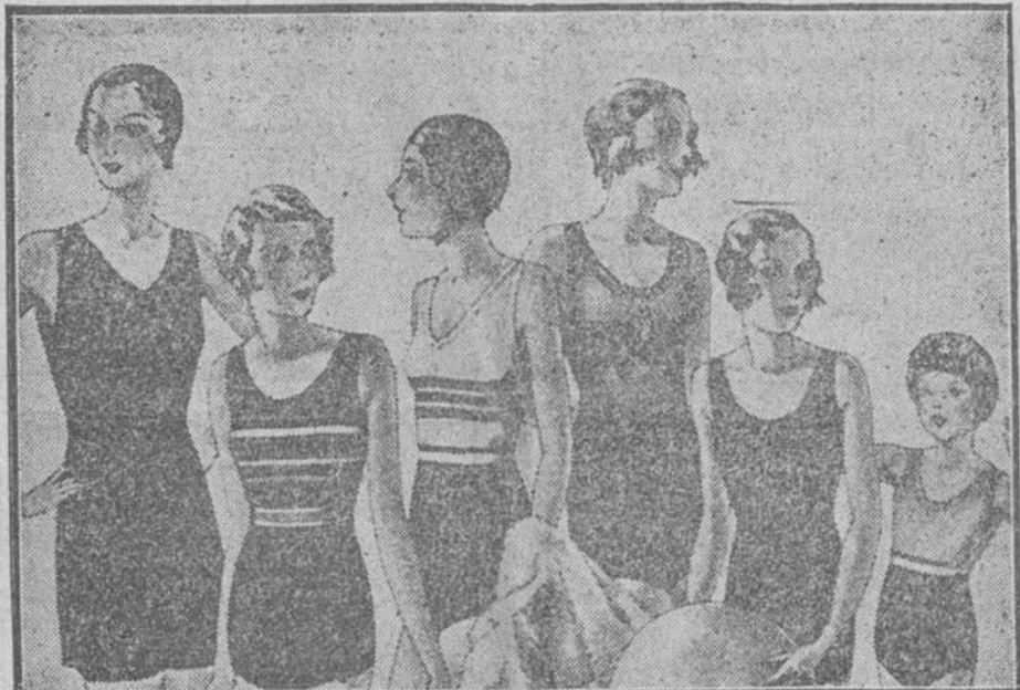
Trajes de baño en lana o algodón para señora, caballero o niños. Pantalón de baño a 1,50, 1,75, 2 y 2,50