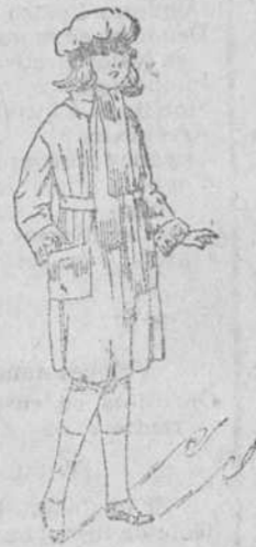
Abriguitos niña, tejidos novedad, a 10, 12, 15 y 20 pesetas