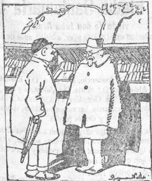
—Tendría por casualidad un pequeño manuario de agricultura? Presento mi candidatura por el distrito agrícola.