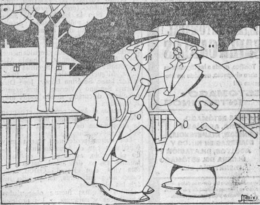
—Te imaginas algo peor que una jirafa con dolor de garganta?

—Según «La Correspondencia de España» es probable que se manden a Bajeares tropas del sexto cuerpo.