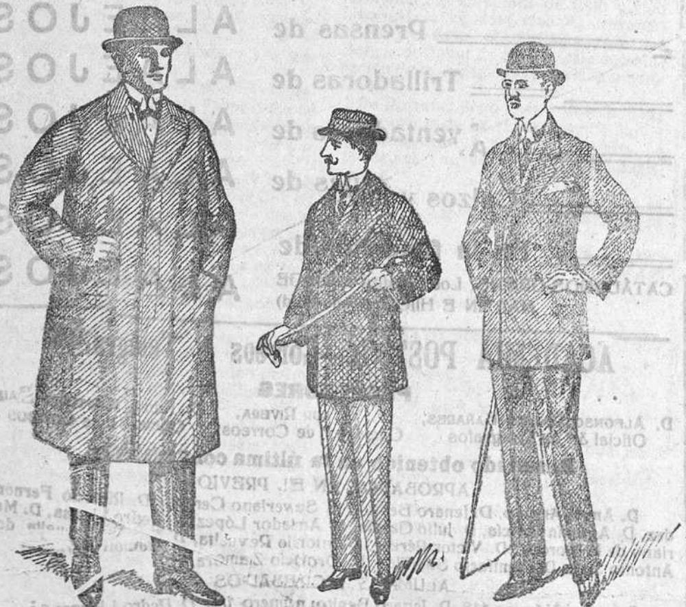
Cabanes de caballero y jóve. Pellizas desde 40 a 125 pesetas. Trajes paño de 30 a 70 ptas. Siempre últimas novedades. 18 a 75 pesetas. pana de 25 a 60. Grandes surtidos. dril de 20 a 35.

Siempre a precios económicos — Precio fijo