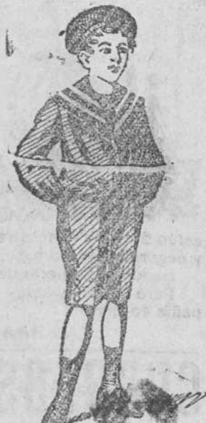
50 modelos diferentes en trajecitos de niños, en dril, paño y pana.

Visiten esta casa y se convencerán de los grandes surtidos que presenta en abrigos gabardina, trajes dril (caballero) y guardapolvos (caballero, señora y niños).