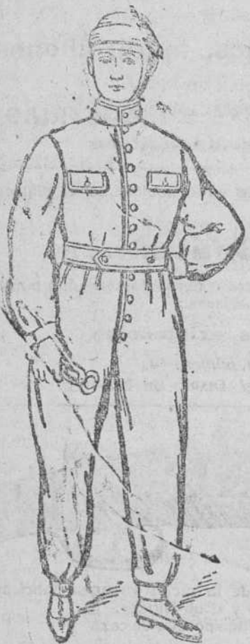
Traje guerrero y pantalón Unidos, en dril azul y negros, impermeabilizados, de 14 á 20 pts.

Espléndido surtido en prendas sueltas para toda clase de trajes de caballero y niños