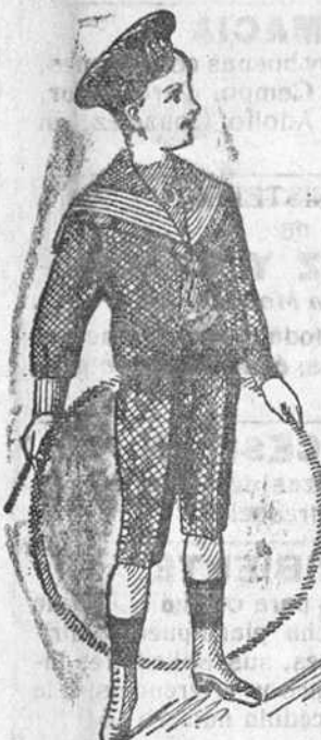
50 modelos diferentes en trajes de niños, en paño, jergas, vicuñas y panaes.