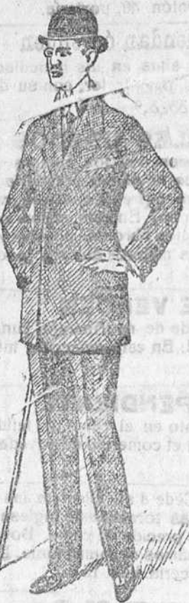
Trejes paño de 30 á 70 ptas. • pana de 25 á 60 • dril de 20 á 35

Esta casa es la única que presenta siempre grandes surtidos en tejidos y ropas confeccionadas de caballero, señora, jovencitos, niños y niñas.