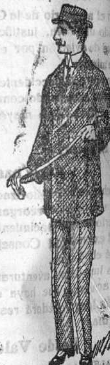
Pellicias desde 18 á 75 pesetas.