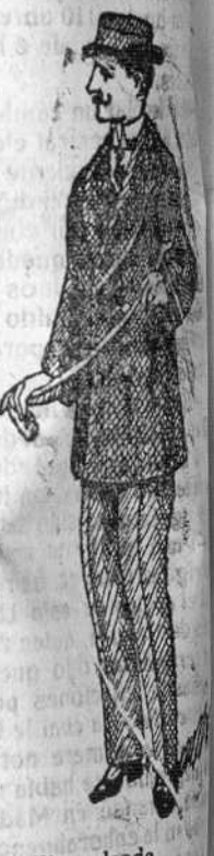
Pellicas desde 18 á 75 pesetas. Grandes surtidos.

Sarpullidos de la Cara Antiguos de 5 años Curados en 3 semanas