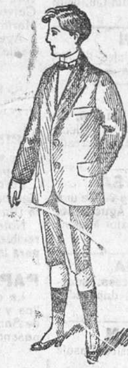
Trajecitos para jóvenes, en americana cruzada y sin cruzar á 20, 25, 30, 35 y 40 pts.