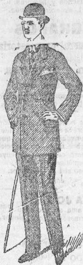
Trajes paño de 30 á 70 pts. pena de 25 á 60 dril de 20 á 35

Esta casa es la única que presenta siempre grandes surtidos en tejidos y ropas confeccionadas caballero, señora, jovencitos, niños y niñas.