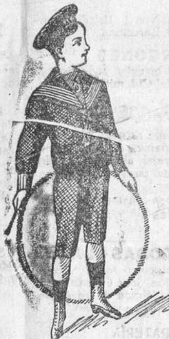
50 modelos diferentes en trajes-citos de niños, en paño, jergas, vicuñas y panas.