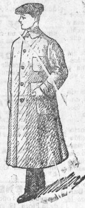
Guardapolvos de caballero, señora, jóvenes y niños á 6, 7, 8, 10 y 15 pesetas.