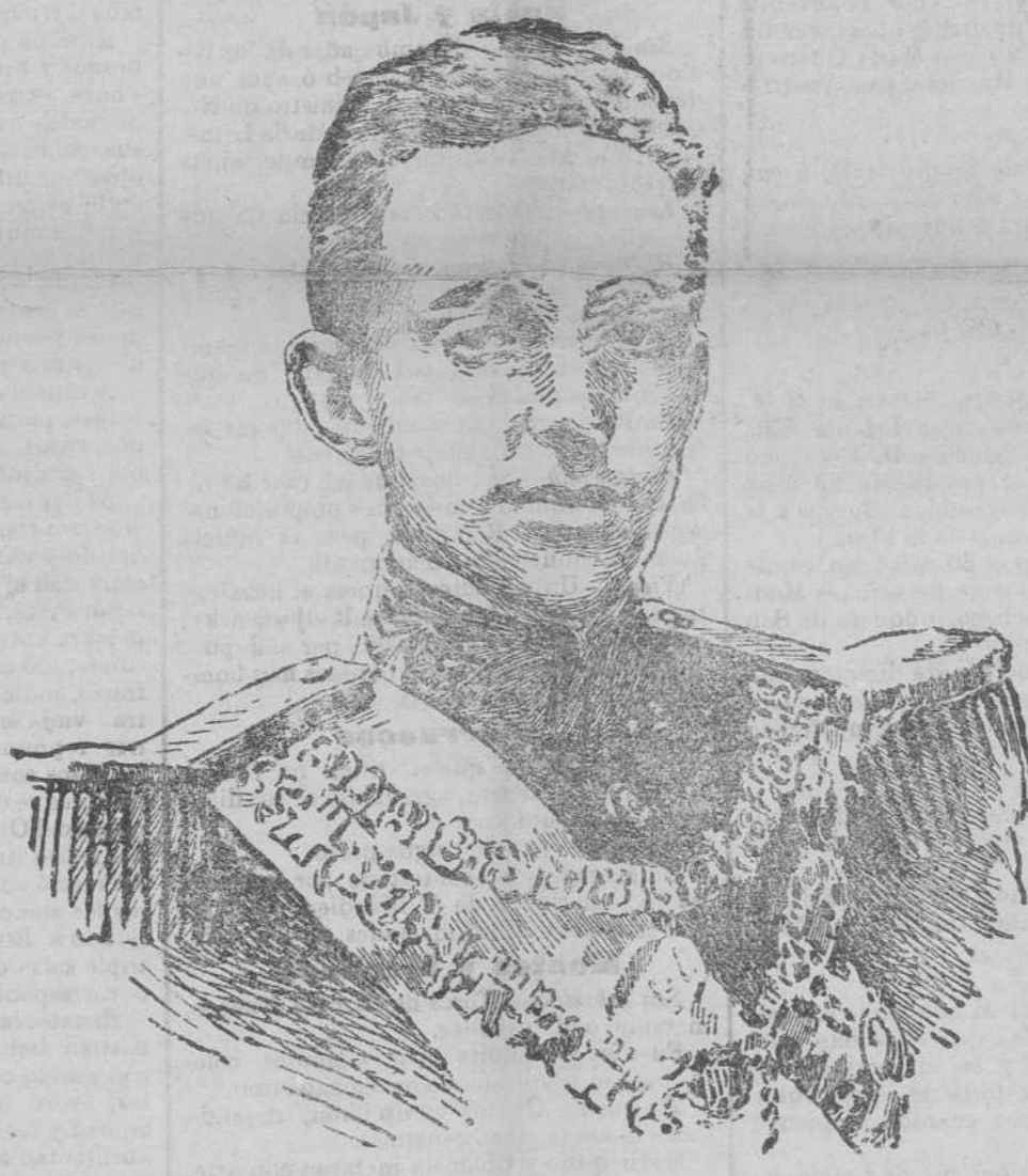
S. M. el Rey D. Alfonso XIII

Además se observarán los contactos, y se