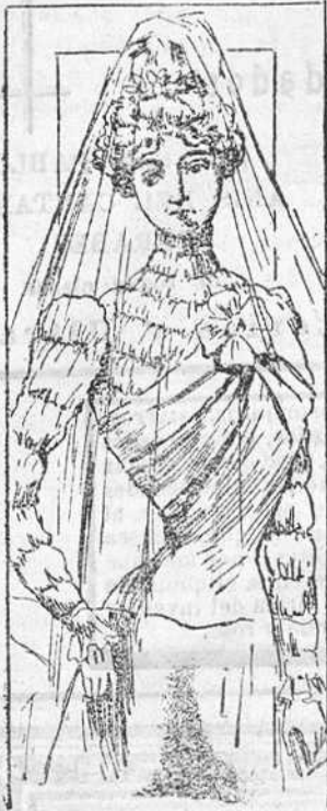
Traje para novia

Modelos exclusivos para nuestras lectoras de los grandes almacenes de EL SIGLO, Barcelona.