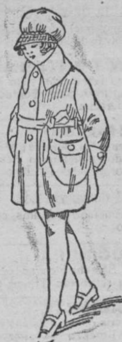
Abrigos paño para niñas, á 12, 15, 20 y 25 pts.