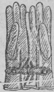
Gautes piel con forro lana, á 10, 15, 20 y 25 pesetas.

Depósito de las sandalias «Paco», con piso de goma, propias para invierno, y de las máquinas de escribir NOISELESS, completamente silenciosas.