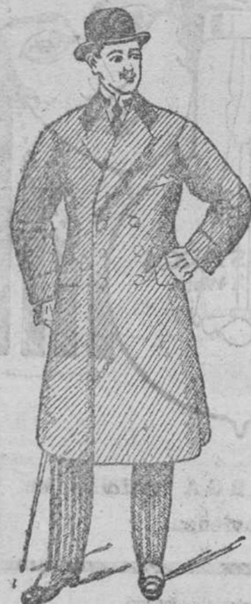
Gabardinas ceballero, á 100, 115, 140 y 150 pesetas.

Plaza Mayor, 42 y Lain-Calvo, 9 — BURGOS —