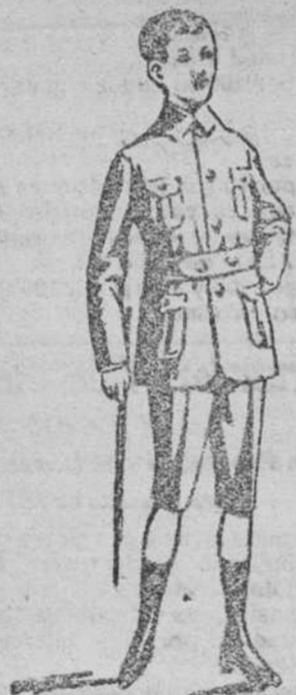
Trejecitos paño, forma sport, á 25, 30, 35 y 40 pts.

Plaza Mayor, 42, y Lain-Calvo, 9.—Teléfono núm. 88.—Burgos PRIMERA CASA EN CONFECCIONES