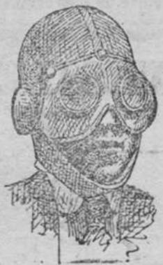
Casaca para motoristas á 5 pts Gafas, 5'50