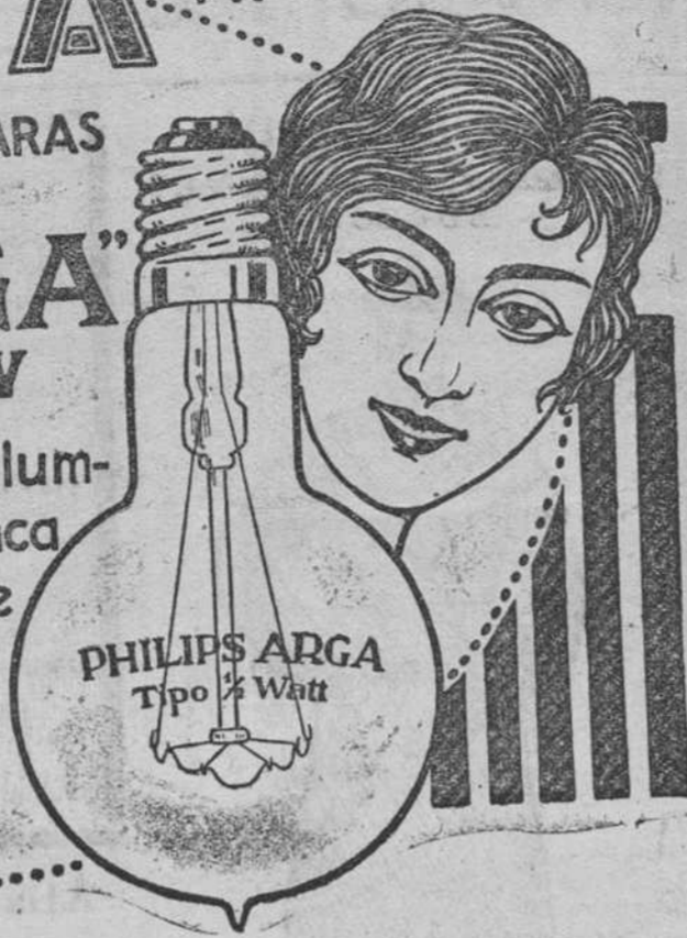
PHILIPS ARGA Tipo 1/2 Watt

Es inútil ocultar la verdad. Las modernas lámparas PHILIPS-ARGA sustituirán en breve plazo las de filamento metálico, que ya no convienen.