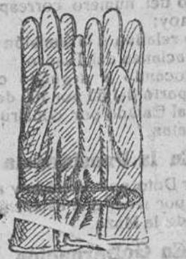
Gautes piel con forro lana, a 10, 15, 20 y 25 pesetas.

Depósito de las sordalías «Paco», con piso de goma, propias para invierno, y de las máquinas de escribir NOISELESS, completamente silenciosas.