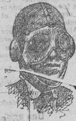
Casaca para motoristas, las a 5 pts. Gafas, 5'50

Depósito de las sordalías «Paco», con piso de goma, propias para invierno, y de las máquinas de escribir NOISELESS, completamente silenciosas.