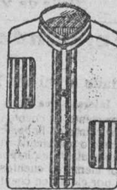
Camisas percal, á 8, 9 y 10 pesetas.

Depósito de las sandalias «Paco», con piso de goma, propias para invierno, y de las máquinas de escribir NOISELESS, completamente silenciosas.