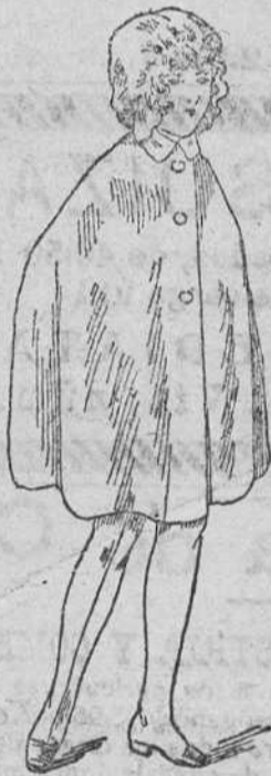
Capitas impermeables, á 10, 12, 15, 20 y 30 pts.