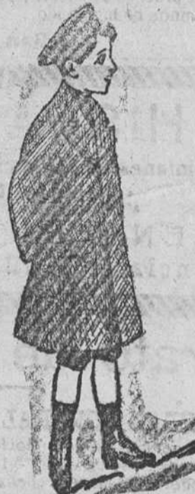
Gebán de paño melton á 25, 30, 40 y 50 pts.