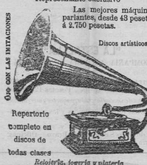
¡OJO CON LAS IMITACIONES!

Las mejores máquinas parlantes, desde 43 pesetas á 2.750 pesetas.