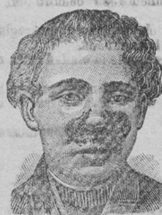
Antes de la curación.

Curación radical de todas las enfermedades de la piel, de las llagas de las piernas y del artrismo, reumatismo, gota, dolores, etc., por medio del Tratamiento de L. RICHELET