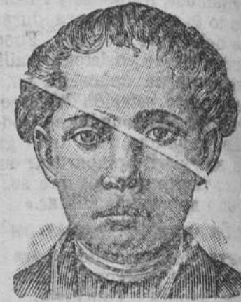
A los 15 días de tratamiento.