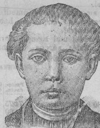
Antes de la curación.