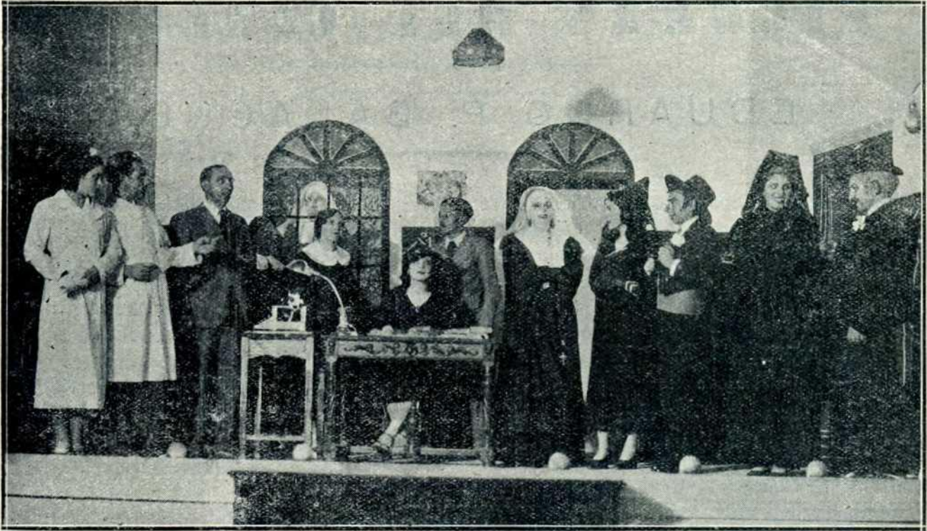
Una escena del tercer acto de «Madre Alegría».