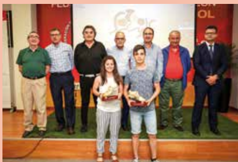
ZAPATILLA DE ORO