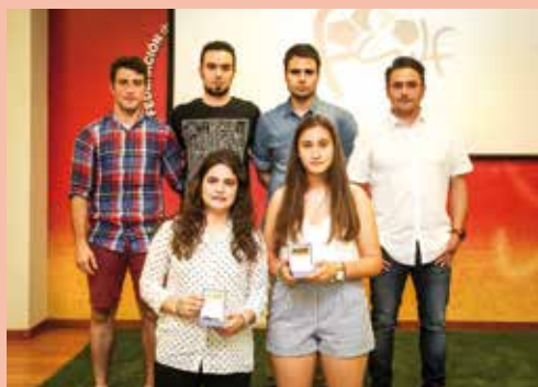
SUB18 Y SUB16 FEM.