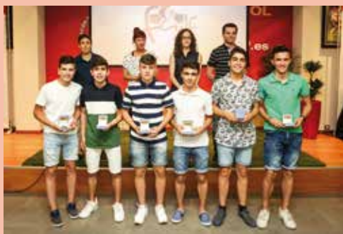
SUB16 FS. MASC.