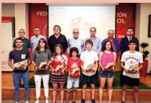
BOTA DE ORO