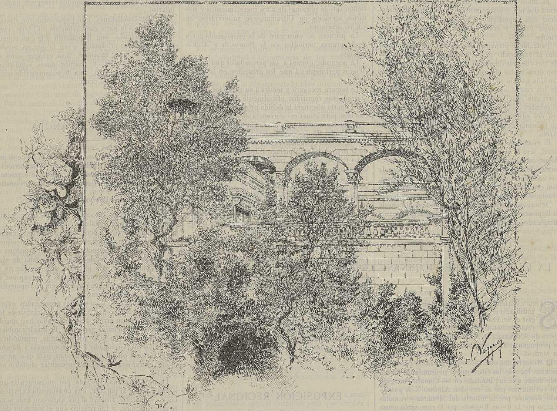
ANEXOS DE LA EXPOSICIÓN.—VISTAS DEL PARQUE

Si tal hubiéramos hecho cuando comenzó á decaer la preponderancia de nuestra marina mercante, no nos hallaríamos ahora con la triste realidad de ver,