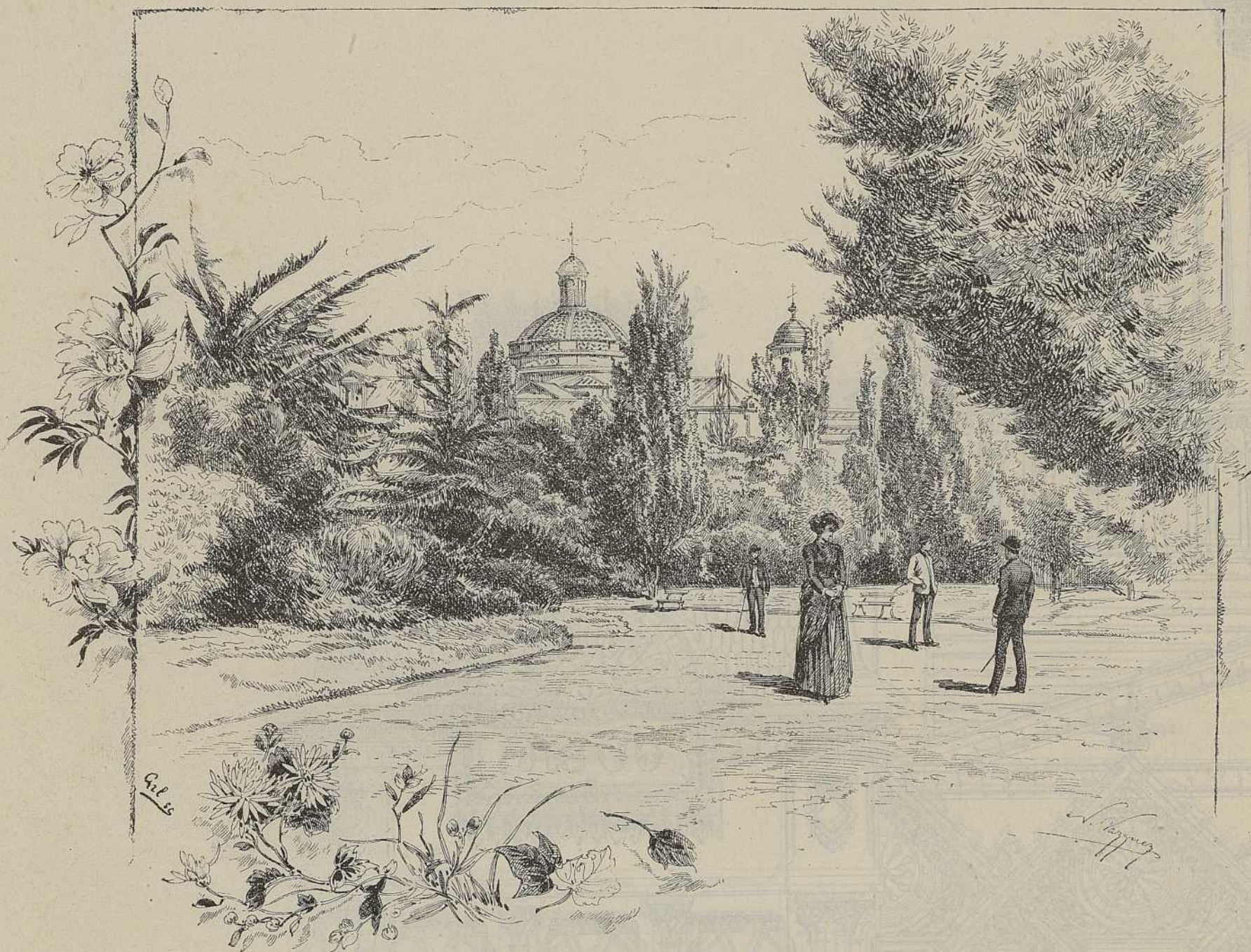
ANEXOS DE LA EXPOSICIÓN.—VISTAS DEL PARQUE

Lo que respecto á mejoras hemos dicho concierne á esta población, debe entenderse aplicable á todas las obras y servicios que corren á cargo del Estado y de la Provincia. ¿Por qué ha de demorar el primero—y lo citamos simplemente como ejemplo—la adquisición del terreno necesario para el Jardín Botánico que ha de rodear el edificio de la