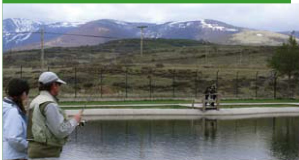
Pineda de la Sierra

Estas instalaciones están abiertas a toda la población, niños, jóvenes y adultos y a los colectivos de pescadores que se inician en esta afición, en particular.