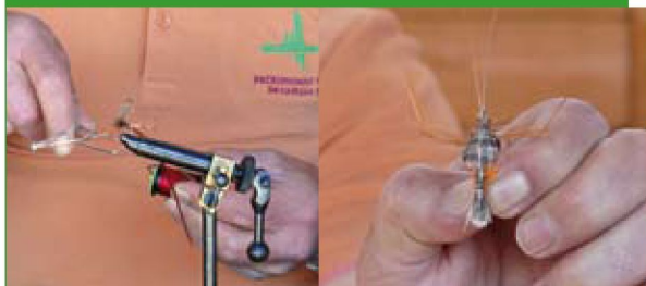
Fabricación de moscas