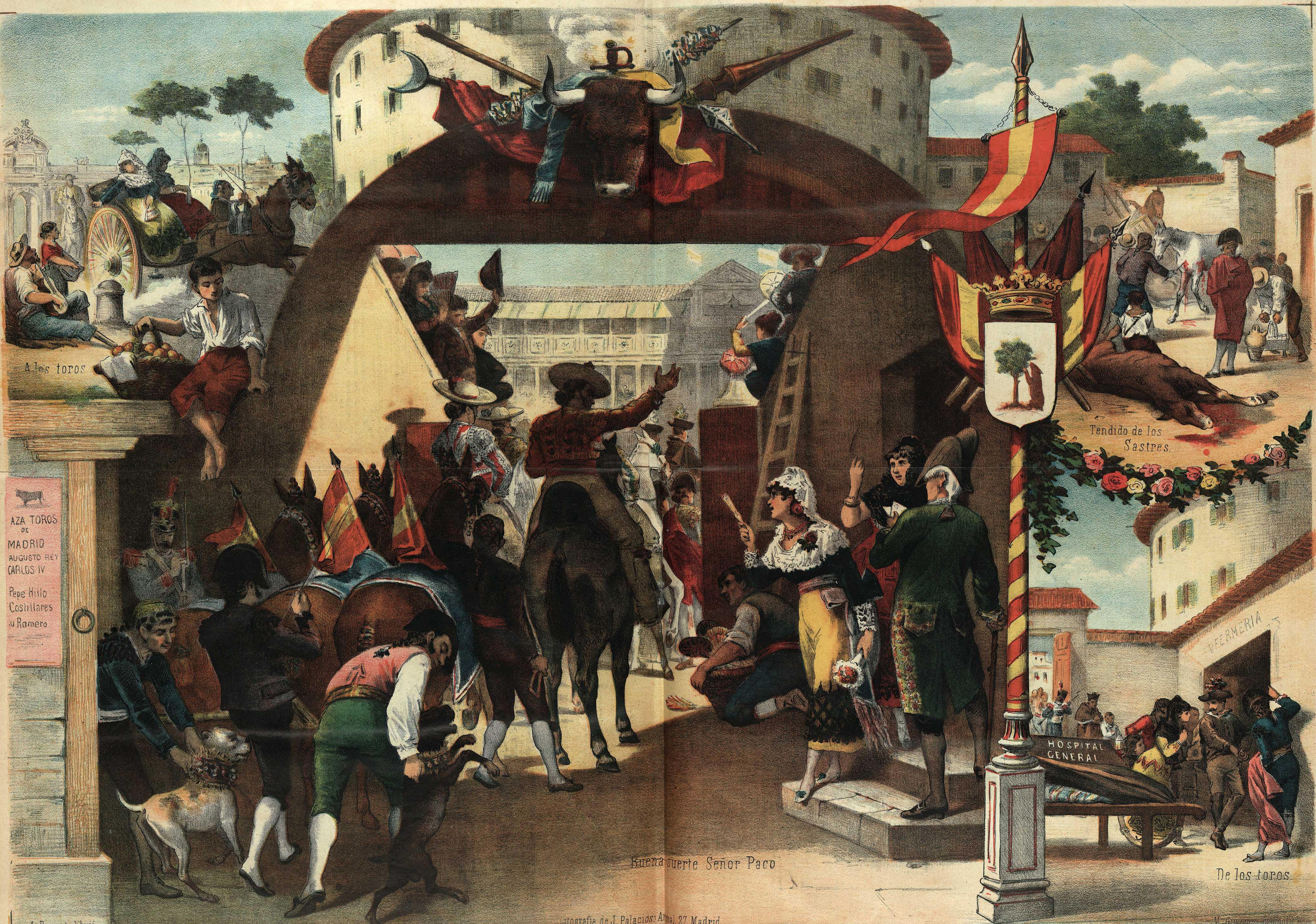
A los toros