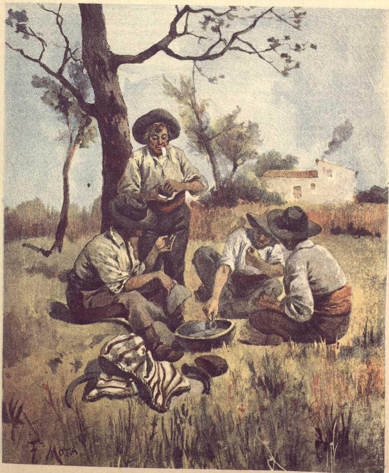
EL GAZPACHO (Acuarela de Mota.)