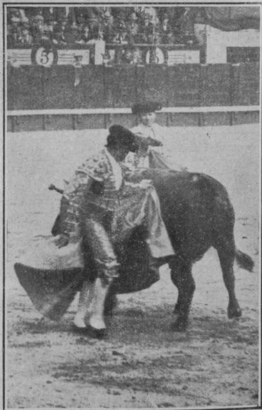
Gaona en la primera de abono

Por la cogida de Camará en el toro quinto, tiene Rodolfo que vérselas con el último de la tarde. Este, que en el primer tercio resulta de lo más bravito de la serie, acometiendo bien a los piqueros y tomando con cierta decencia las puyas de reglamento, vá por segundos agotándose, y en estas condiciones llega a la jurisdicción de Gaona el toro bastante quedado e inofensivo; tenía algo descompuesta la cabeza, la cual le arregla admirablemente Gallito, con unos eficaces chicotazos que dejan al bicho como para armar el escándalo un torero como Rodolfo, pero decididamente a éste no le da la republicana gana, y de ahí que la faena resulte de lo más sosa, tonta e incolora que se pueda ver. Sin pasar de la cara el torero, se queda solo largando mantazos y de cuando en cuando algún Pingüi que otro