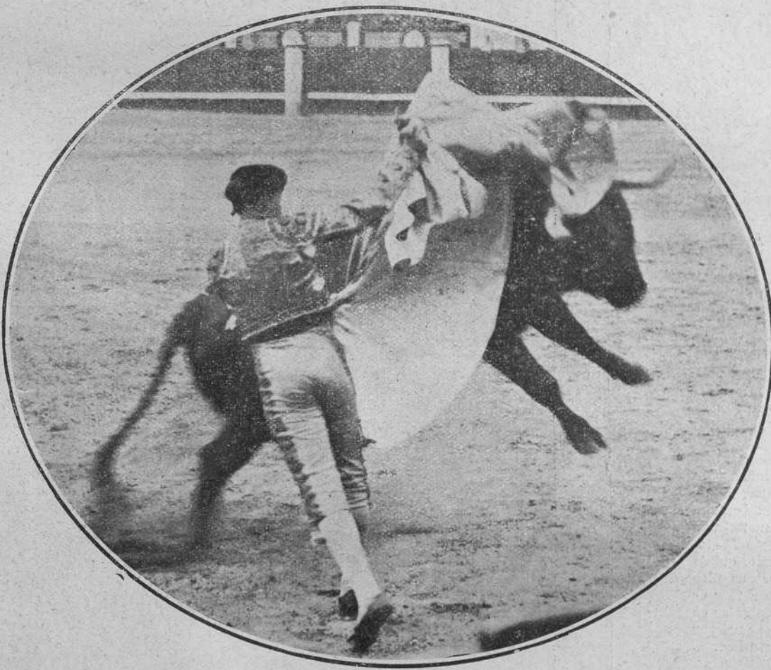
Joselito en la primera de abono

Con la muleta el hombre de Córdoba se crece en valentía, pero como consiente demasiadas libertades a los subalternos, el veragüeño se espabila y achucha de lo lindo, derribando en un pase al matador, que resulta con una buena pateadura. Sigue el hombre valiente y da algunos pases que se