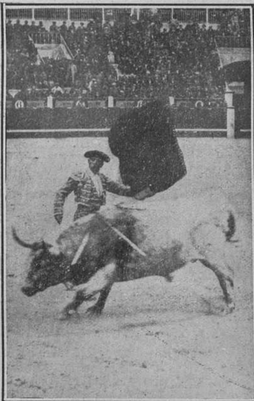
Cocherito ayer en Madrid.

A la hora de empezar el espectáculo un llenazo de los de órdago a la grande , viéndose entre el sexo feo una muy nutrida representación del elemento femenino, que daba realce a la fiesta, y que con sus ojos y sus caras bonitas, suplieron el calor y brillo del astro Febo que se empeñó en brillar... pero fué por su ausencia.