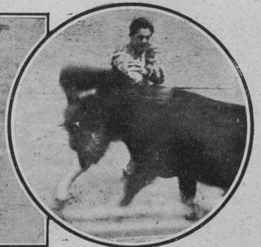
Pacorro en la misma corrida.