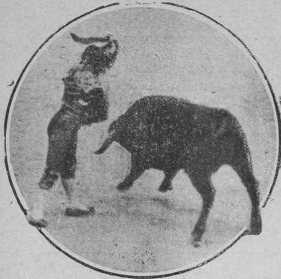
Varelito el día 1 de Abril en la Plaza de las Arenas de Barcelona