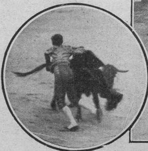
Posadero el 31 en Barcelona.