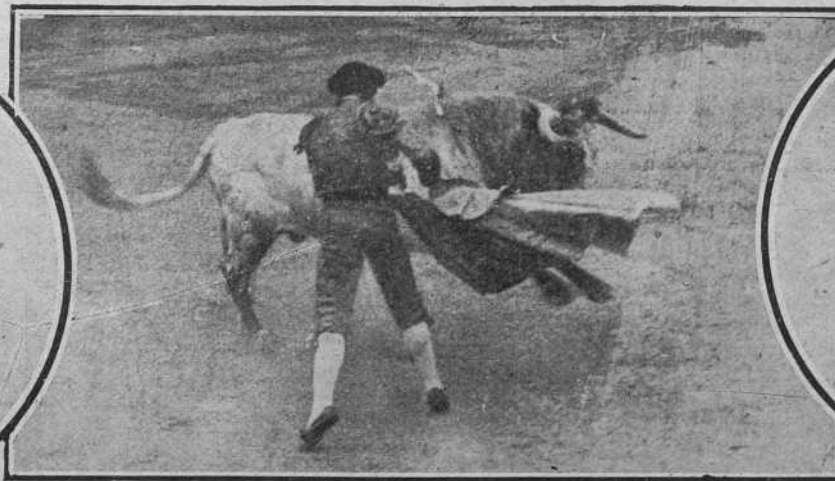
Chatillo de Baracaldo el 31 en Barcelona.