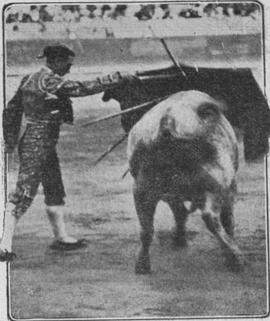
Bienvenida pasando de muleta al primero en la corrida celebrada el 8 en Valencia.