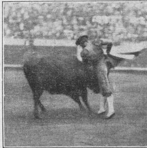
Carnicerito el 8 en la Monumental de Barcelona