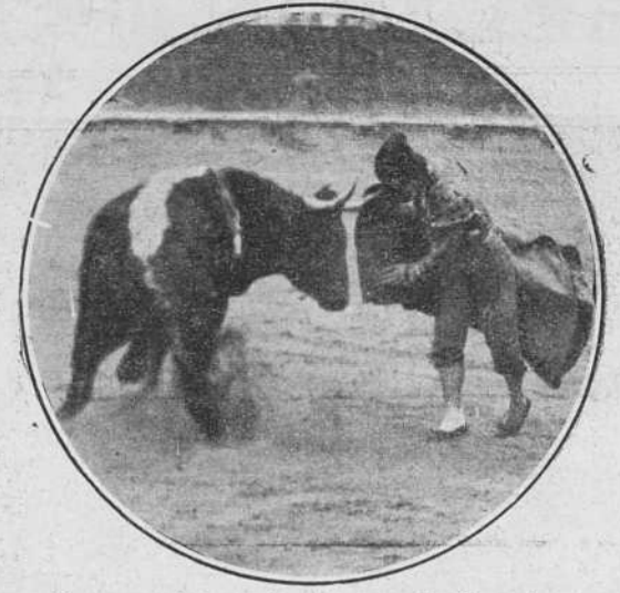
Pacorro el 8 en las Arenas de Barcelona.

Al quinto le toma con el capote encerrándole en