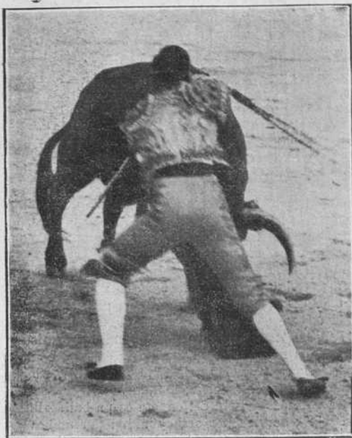
Montes matando ayer en Vista Alegre.