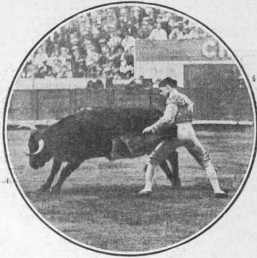
Zarco el 8 en la Monumental de Barcelona.

balcón para que por lo menos lleguen hasta aquí las voces y la alegría de la calle.