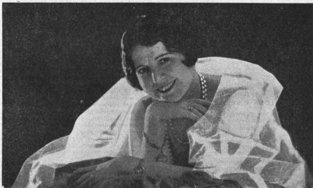
La eminente actriz señora Asunción Pastor, con cuyo arte exquisito adquieren positivos méritos nuestros más brillantes festivales.