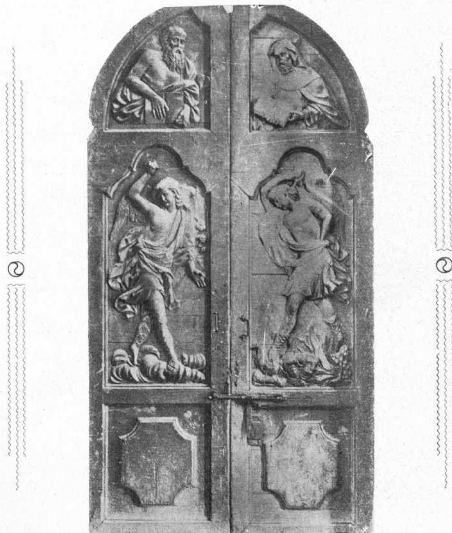
ASTORGA.—PUERTA DEL CLAUSTRO DE LA CATEDRAL

Organo oficial de la Asociación CENTRO REGIÓN LEONESA