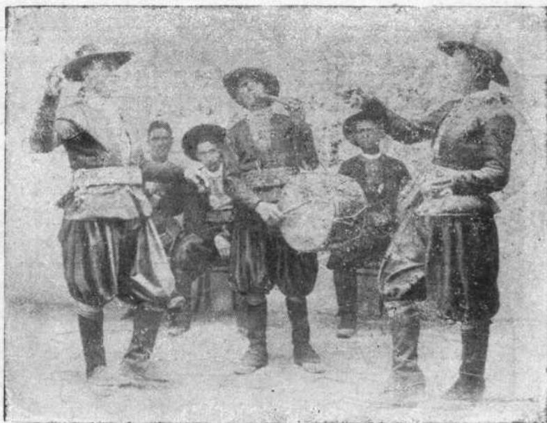
GRUPO DE MARAGATOS (LEÓN)