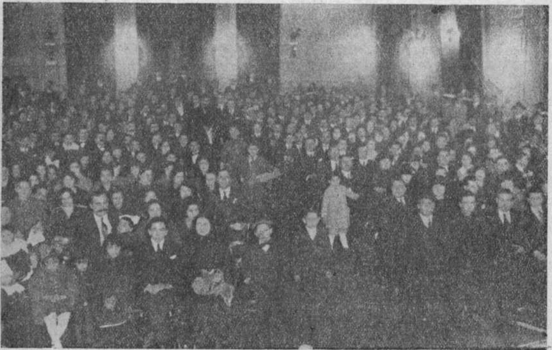
ASPECTO DE LA SALA

Mañana celebra la República Argentina bajo cuyo pabellón vivimos, el 105 aniversario de la Jura de la Constitución; es decir, la Carta Magna por la que han de regirse, según expresa, todos los hombres de buena voluntad que quieran habitar su territorio, el C. R. L., con cuya inmerecida presidencia se me honra, al asociarse como lo ha hecho siempre, a cuanto acto de argentinidad se ha producido en estos últimos tiempos, de incertidumbre y de enconos mal comprimidos, lo hace hoy con la dualidad de festejar, no solo