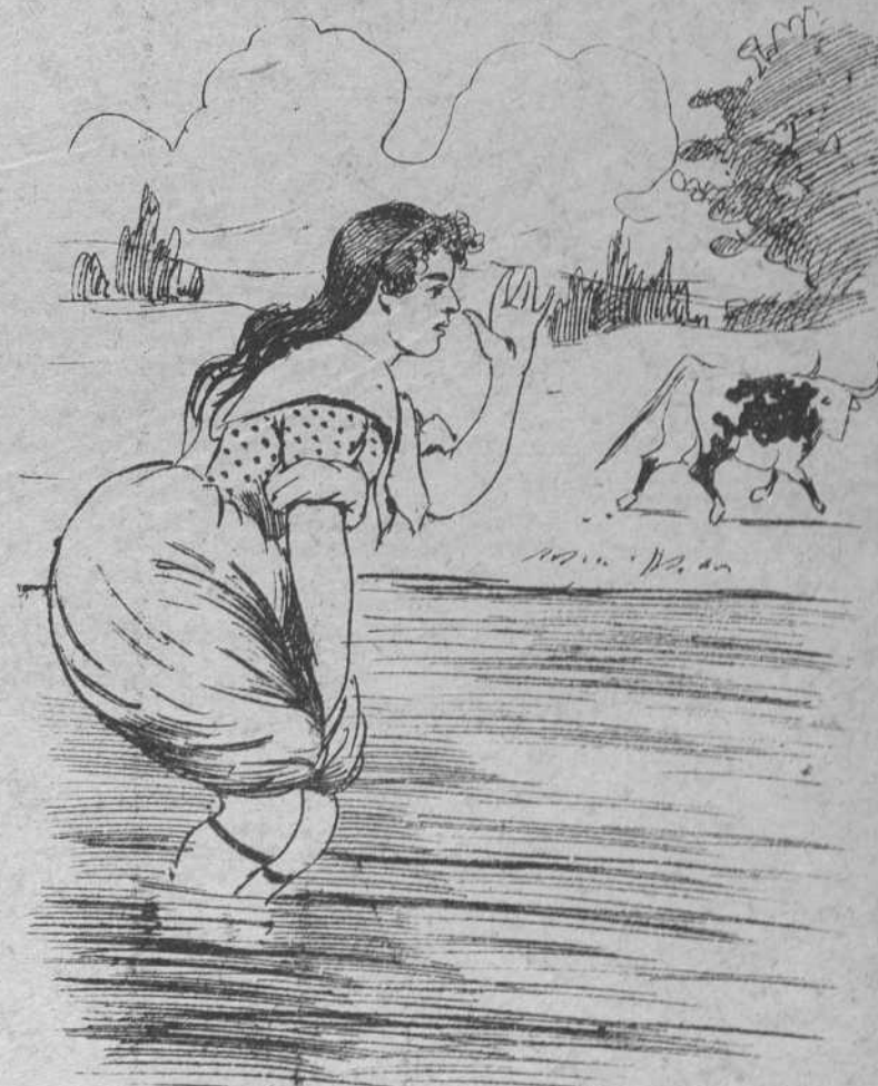
8 y la vaquere infeliz al verse libre, gozaba y hacia el toro señalaba con un palmo de nariz.