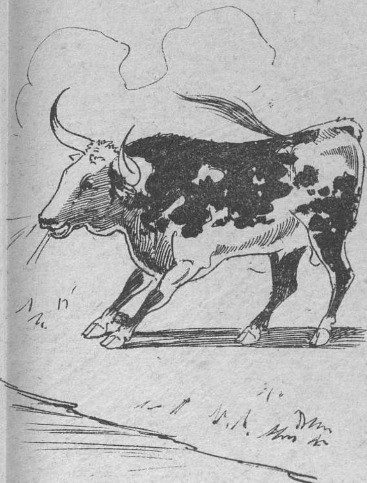
7 Cara sucia, así atajado en su viaje codicioso, bramó y escarbó rabioso, alejándose espantado,