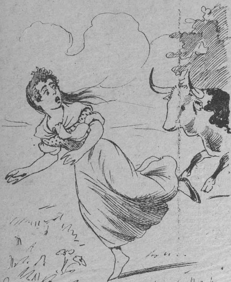
5 Asombrada la mujer ante tan bestial capricho, quiso librarse del bicho corriendo á todo correr.