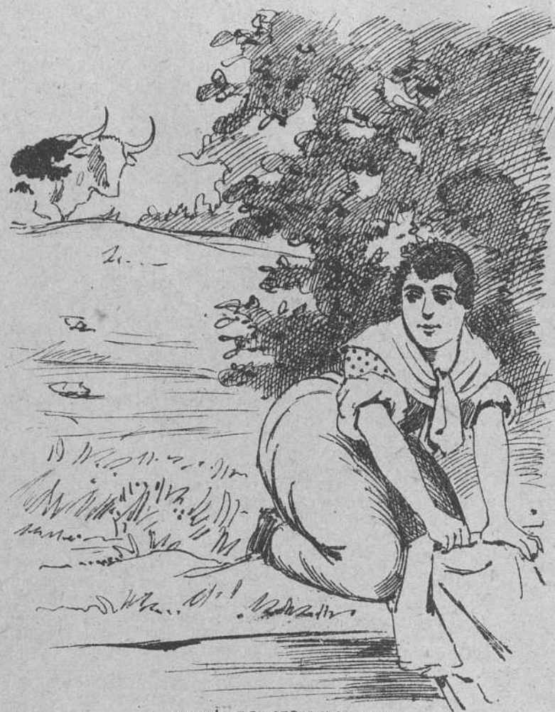
2 cuando por entre una jara, Cara sucia, toro serio, con cautela y con misterio asomó la sucia cara.