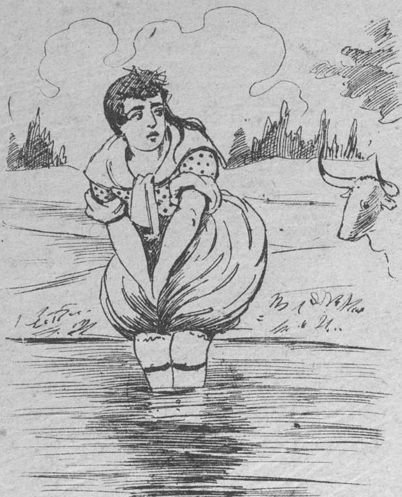
6 mas comprendiendo que, impío, el toro la daba alcance, se metió en tan duro trance de patitas en el río.