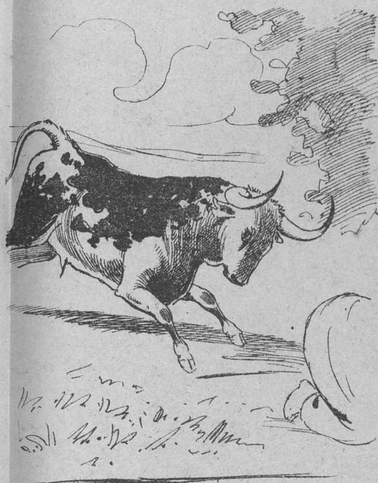
3 Juzgando el agua y jabón para su nombre una injuria, el animal montó en furia y de primera intención,