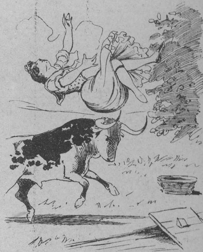
4 arrancándose irascible a la pobre lavandera, la dió un susto de primera en un volteo terrible.